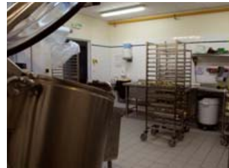
▲ Légumerie dans un établissement de la métropole nantaise

De quoi booster la structuration des filières dans la Région et soutenir nos paysans !